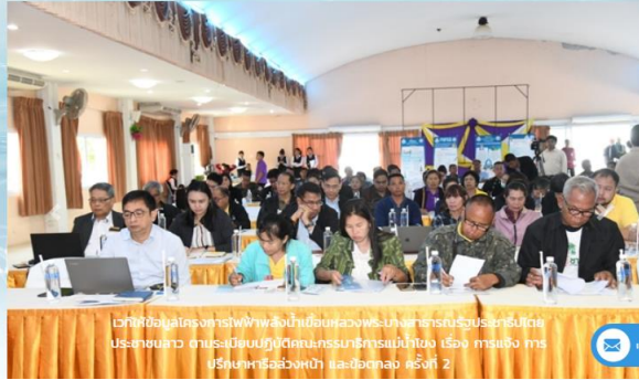
เวทีการประชุมการฟื้นฟูสิ่งแวดล้อมเขื่อนหลวงพระบาง สหประชาชาติ ประเทศไทย ตามเป็นปฏิญญาความร่วมมือระหว่างไทย เรื่อง การแจ้ง การ ปรึกษาหารือล่วงหน้า และข้อตกลง ครั้งที่ 2