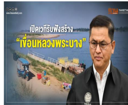
เปิดเวทีรับฟังสร้าง "เขื่อนหลวงพระบาง"