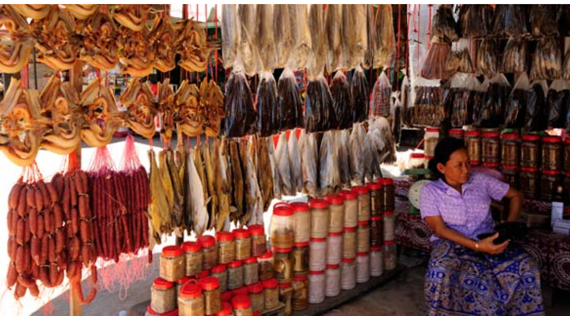
ຄວາມຮັບຜິດຊອບຂອງອົງການແມ່ນ້ຳຂອງສາກົນ ໃນການເຊື່ອມ ບົດບາດ ຍິງ-ຊາຍ ເຂົ້າໃນການພັດທະນາ ຊັບພະຍາກອນນ້ຳໃນພາກພື້ນອ່າງແມ່ນ້ຳຂອງຕອນລຸ່ມ

ຍຸດທະສາດ ບົດບາດ ຍິງ-ຊາຍ ຂອງຄະນະກຳມາທິການແມ່ນ້ຳຂອງສາກົນ ມີຈຸດມັງຫມາຍ ເພື່ອຈະເຊື່ອມສານ ແລະ ສິ່ງເສີມແນວຄວາມຄິດ ບົດບາດ ຍິງ-ຊາຍ ເຂົ້າໃນແນວທາງນະໂຍບາຍ, ແຜນການ, ແຜນງານ ແລະ ໂຄງການ ຂອງ ຄະນະກຳມາທິການແມ່ນ້ຳຂອງສາກົນ. ຍຸດທະສາດດັ່ງກ່າວນີ້ ແມ່ນຖືກສ້າງຂຶ້ນ ເພື່ອປະກອບສ່ວນ ແລະ ສະໜັບສະໜູນ ຍຸດທະສາດອື່ນໆທີ່ມີຈຸດປະສົງ ເພື່ອບັນລຸ ເປົ້າຫມາຍຂອງການພັດທະນາແບບຍືນຍົງ ທາງດ້ານສັງຄົມ ແລະ ສິ່ງແວດລ້ອມ. ພາຍໃຕ້ຂອບເຂດ ແລະ ຫລັກການຂອງແຜນຍຸດທະສາດ ຂອງຄະນະກຳມາທິການແມ່ນ້ຳຂອງສາກົນ ແມ່ນລວມມີການສາງນະໂຍບາຍ ຂອງອົງການເພື່ອເຊື່ອມປັດໃຈທາງດ້ານສັງຄົມ ເຂົ້າໃນກິດຈະກຳຂອງການພັດທະນາ ກຸ່ງວັກບ້ຳ ແລະ ຊັບພະຍາກອນ ທີ່ກຸ່ງວັກອື່ນໆ. ການຊຸກຍູ້ສິ່ງເສີມ ການປະຕິບັດ ນະໂຍບາຍຫລໍ່ານັ້ນ ໂດຍຜ່ານຂະບວນການ ສ້າງຈິດສຳນຶກ ແລະ ການສ້າງ ຄວາມສາມາດ ໂດຍຜ່ານການເຜີຍແຜ່ ແລະ ແນະນຳກຸ່ງວັກເຄື່ອງມື ແລະ ວິທີການ ຕ່າງໆທີ່ເປັນຕົວຊ່ວຍໃນວຽກງານການຈັດການ ແລະ ຄຸ້ມຄອງ. ■