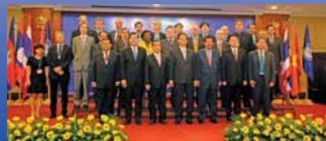
ผู้นำและรัฐมนตรีทั้ง 6 ประเทศในลุ่มน้ำโขง-ล้านช้าง ทุน กับคู่ค้าด้านการพัฒนาลุ่มน้ำโขงในการประชุมปี 2014