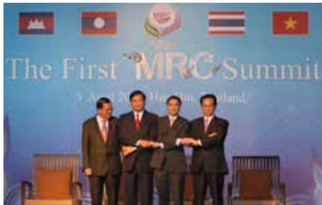
นายกรัฐมนตรีประเทศกัมพูชา ลาว เวียดนามและประเทศไทย แสดงความเป็นปึกแผ่นของประเทศสมาชิกสี่ประเทศ ในการประชุมปี 2010