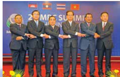
ผู้นำและรัฐมนตรีในลุ่มแม่น้ำโขงจากคู่มือเจรจาของ MRC ประเทศจีนและประเทศพม่าในที่ประชุมปี 2014