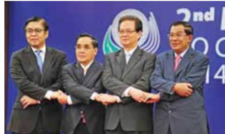
นายกรัฐมนตรีของประเทศกัมพูชา, สาธารณรัฐประชาธิปไตย ประชาชนลาวและเวียดนามและผู้แทนนายกรัฐมนตรีของไทย ได้แสดงความมุ่งมั่นร่วมกันในการแก้ไขปัญหาสำคัญหลาย ประการที่ลุ่มน้ำโขง